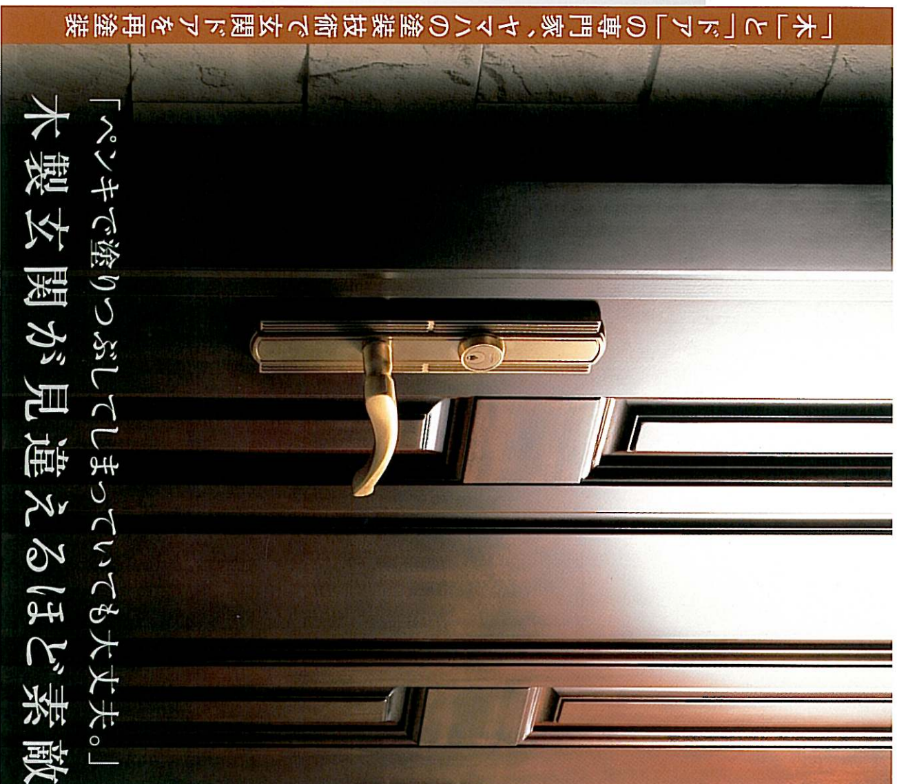
「木」と「ドア」の専門家、ヤマハの塗装技術で玄関ドアを再塗装