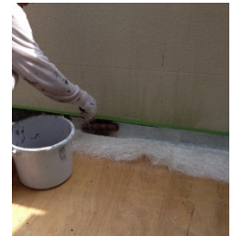
バルコニー防水工事